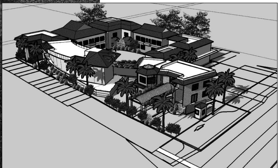
Maquette provisoire du projet de Village Chance