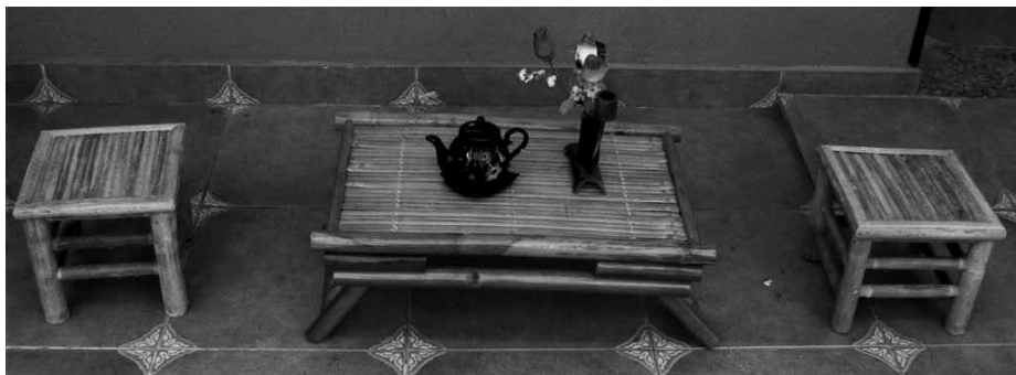
Sièges et table basse fabriqués à l'atelier menuiserie du Centre envol

Depuis que le Centre Envol a ouvert ses portes en février 2006, la production réalisée par les personnes handicapées s'est beaucoup développée.