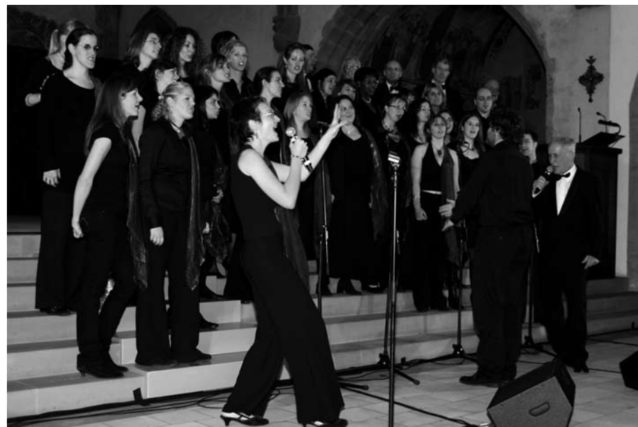
«God be with you»: chœur final du concert de Saint-Gervais (GE), avec Gospel Spirit et les Morning Fellows

a eu lieu à Saint-Prex le 29 novembre, a rapporté 13'200 francs. La collecte du concert de gospel du 23 novembre, à Genève, a atteint 5'800 francs, entièrement versés à la Maison Chance du fait que les chanteurs et les techniciens ont renoncé à toute rétribution. Merci à tous!