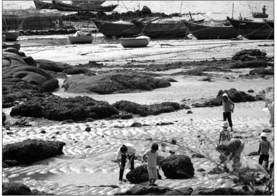
Bord de mer, avec des «thung», paniers-bateaux, typiques de la région (Commune de Khanh Hai, Province de Ninh Thuan)