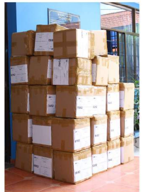
Petite partie des nombreux cartons envoyés.

Au niveau logistique, le Bureau de projets a collaboré avec Maison Chance Suisse afin de coordonner la réception de tous les cartons notamment. Le Bureau de projets a également géré tout ce qui concerne le transport.