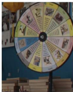
La roue de la chance

Le principe était simple, chaque case de la roue comportait un signe du zodiaque asiatique, chaque personne faisant tourner la roue et tombant sur son signe astrologique emportait une boîte de libellules, confectionnées par nos bénéficiaires.