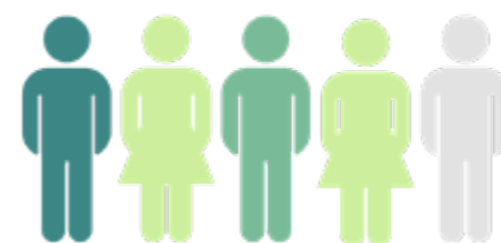
Le nombre de classes parrainées

À ce jour, les résultats sont prometteurs :