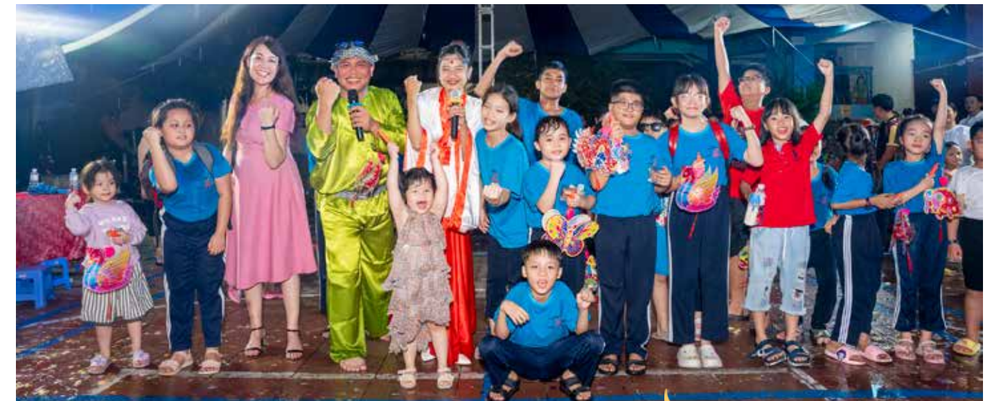
La grande famille de Maison Chance lors de la fête de la mi-automne organisée au Village Chance en partenariat avec l'association des jeunes entrepreneurs de Hồ Chí Minh-Ville, branche Cholon