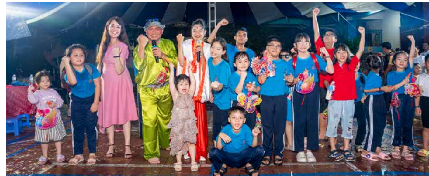
La grande famille de Maison Chance lors de la fête de la mi-automne organisée au Village Chance en partenariat avec l'association des jeunes entrepreneurs de Hồ Chí Minh-Ville, branche Cholon