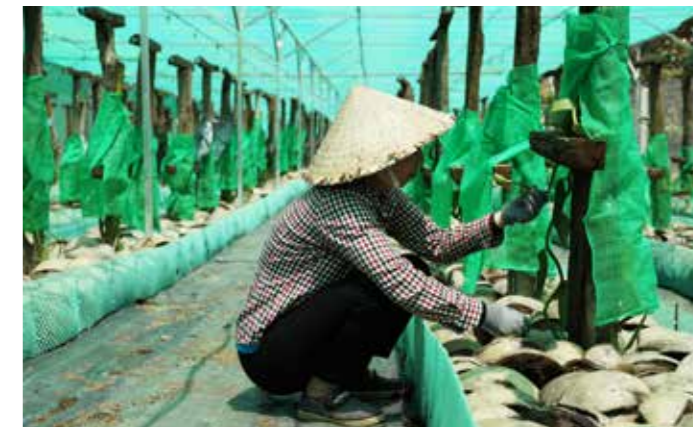
Trồng cây vani đòi hỏi nhiều công sức và tỉ mỉ.

Qua nghiên cứu của các chuyên gia có kinh nghiệm, điều kiện khí hậu thời tiết một số nơi tại Việt Nam phù hợp cho sự sinh trưởng của loại cây này. Đó là vùng trồng có độ cao dưới 1.000m so với mực nước biển, có nhiệt độ không quá lạnh. Về đất trồng, cây vani chủ yếu được trồng trong giá thể, khu vực trồng là nơi ít nắng như dưới tán cây, nhà lưới che nắng.