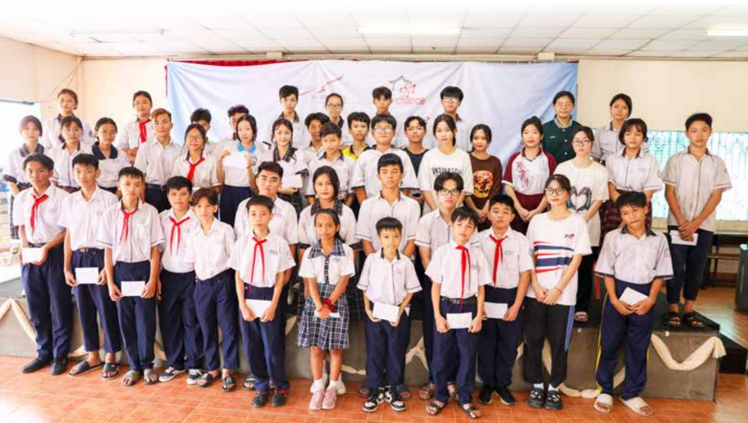
Các em sinh viên học sinh gia cảnh khó khăn tiếp tục được nhận học bổng của Nhà May Mắn sau khi học xong tiểu học ở đây

Vì tri thức là chìa khóa thay đổi số phận, Nhà May Mắn chăm lo các em trong thời gian học tập ở đây và đồng hành, ủng hộ đến cùng những trẻ em không được sinh ra là ngôi sao may mắn vẫn có thể tự tỏa sáng bằng nghị lực và khả năng của mình.