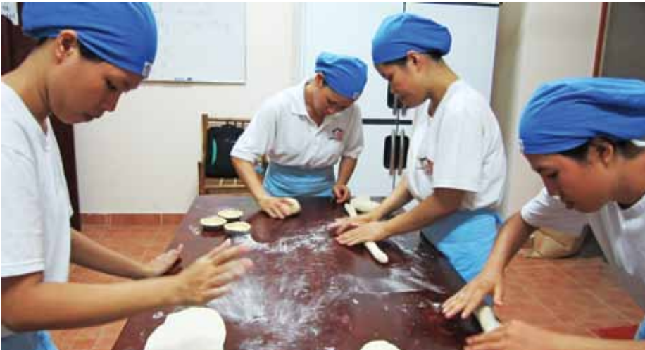
Học làm bánh

Khóa đào tạo bắt đầu từ tháng 12/2011 và sẽ kéo dài 9 tháng. Trong suốt thời gian này, các học viên sẽ được trau dồi nhiều công thức làm bánh mì khác nhau, làm bánh ngọt, bánh ga-tô, bột bánh các loại, bánh quy và làm kem.