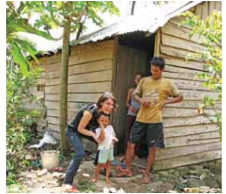
Gia đình YBat - H'Nhac, Xã Buon Choah

nhất/ hoặc tìm cho họ một nơi nương náu thật sự cho phần còn lại của cuộc đời họ (người khuyết tật già.)