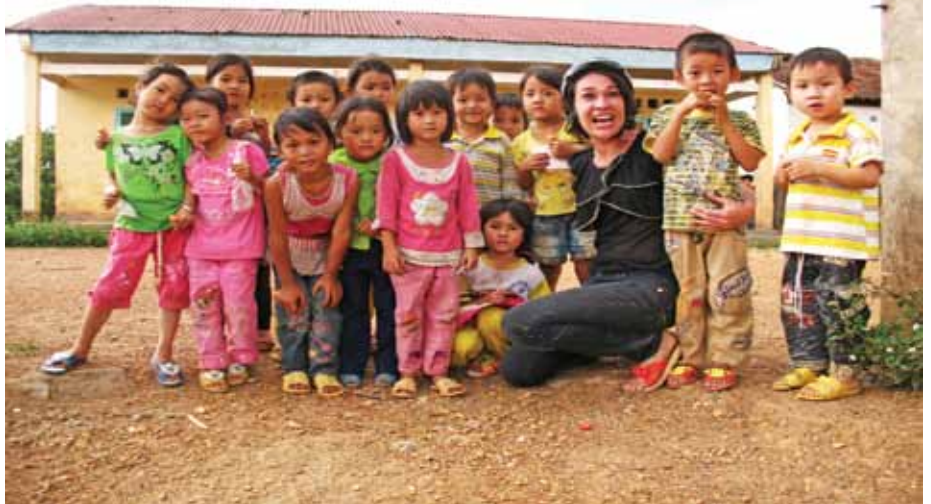
Trường mầm non Hoa Mi Huyện Krông Nô - Tỉnh Đắk Nông

Dự án này sẽ tiến xa hơn, Maison Chance sẽ hỗ trợ các đối tượng bằng một quy mô lớn hơn bằng cách cung cấp một cuộc sống với chất lượng tốt cả về vật chất lẫn tinh thần cho những người có hoàn cảnh khó khăn; người trẻ và người già, bởi vì mỗi giai đoạn của cuộc sống của họ là một giây phút quý giá để có thể sống với điều kiện