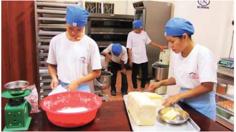
Chuẩn bị làm bánh

Sáu trẻ em đường phố/mò côi được theo học khóa làm bếp chuyên nghiệp và hai trong số đó đang ở học phần cuối của một trung tâm nghiệp vụ nhà hàng. Bốn học viên còn lại thì đang chăm lo bữa trưa hàng