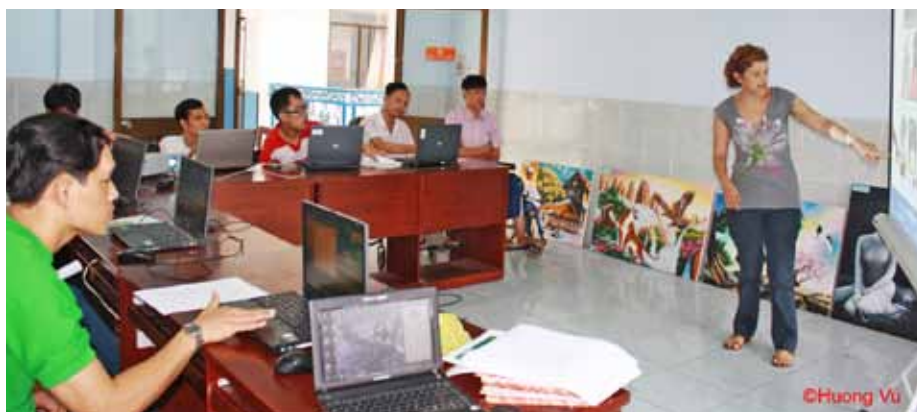
Lớp học về nghệ thuật viết văn