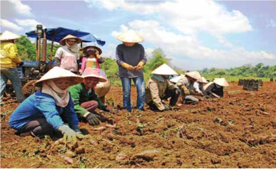
Nông dân Huyện Krông Nô - Tỉnh Đắk Nông đang thu hoạch khoai

Ý tưởng của dự án này là tái thành lập một “Mô hình Nhà May Mắn” tại vùng nông thôn nghèo (cách 200km về phía Bắc của thành phố Hồ Chí Minh), trong một môi trường nông thôn nơi có một tỷ lệ lớn người khuyết tật và trẻ em không nhận được các chương trình giáo dục trong khu vực này. Vì thiếu chăm sóc nên những người yếu nhất có thể chết trước khi họ có thể khẳng định mình trong xã hội.