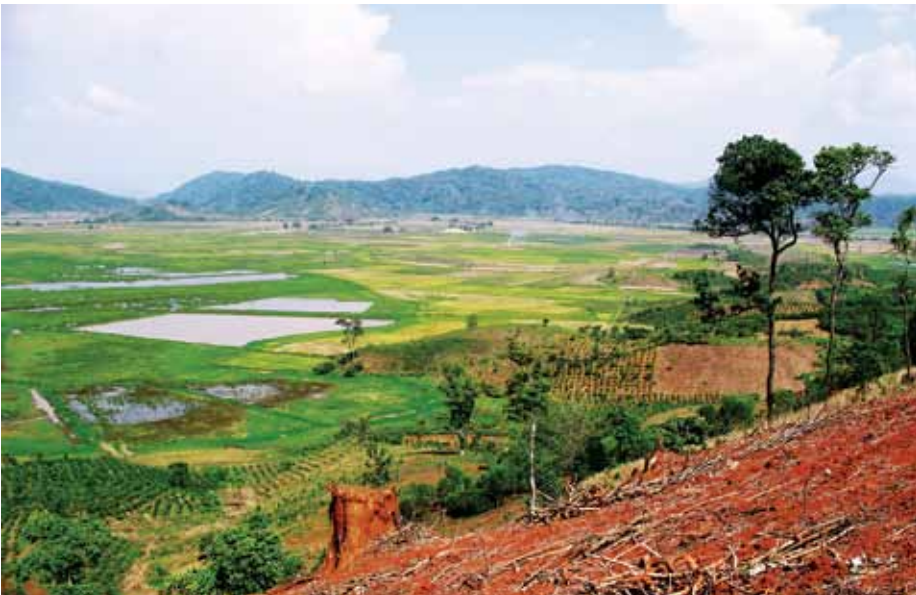
Xã Nam N'Đir - Huyện Krông Nô

tốt nhất có thể có để được hạnh phúc và có ích cho xã hội. Cụ thể là Tổ Chức muốn mang đến cho họ cuộc sống tốt đẹp hơn.