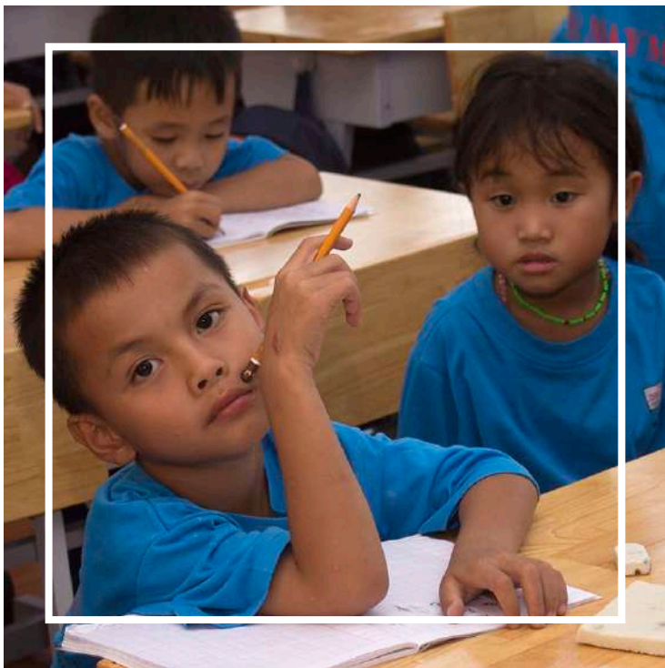
Học sinh tại TTBTXH Nhà May Mẫn Đắk Nông