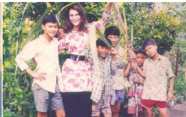
Những em nhỏ đầu tiên