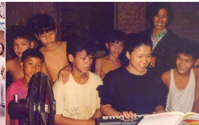
Quây quần bên nhau