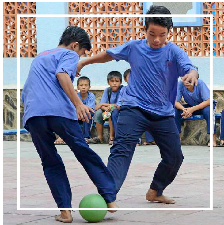
Chơi banh tại sân trường Làng May Mẫn