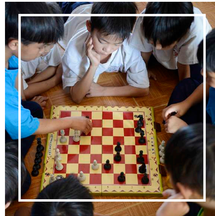
Chơi cờ tại TTBTXH Nhà May Mẫn Đắk Nông