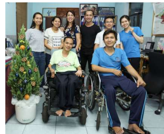
VĂN PHÒNG DỰ ÁN TRUNG TÂM CHẤP CÁNH

Tel: (+84) 0903.686.305 Email: tim@maison-chance.org FB: fb.com/tim.rebeaud