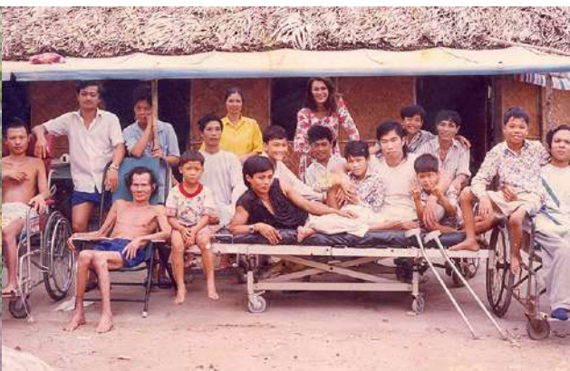
Ngôi Nhà May Mắn