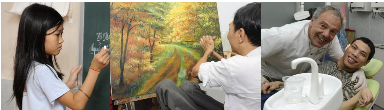
LE CENTRE SOCIAL MAISON CHANCE A HO CHI MINH VILLE

En parallèle du suivi des programmes à Ho Chi Minh Ville, Maison Chance a poursuivi la mise en place du projet de création d'un centre social dans la province de Dak Nong.