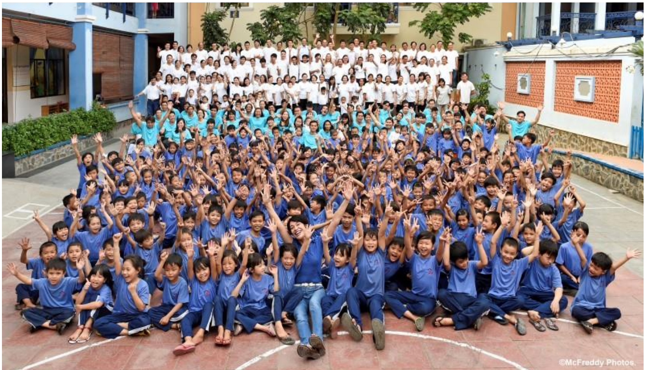
La famille Maison Chance avec en blanc les employés et les bénévoles, en turquoise les bénéficiaires handicapés et en bleu tous les enfants.