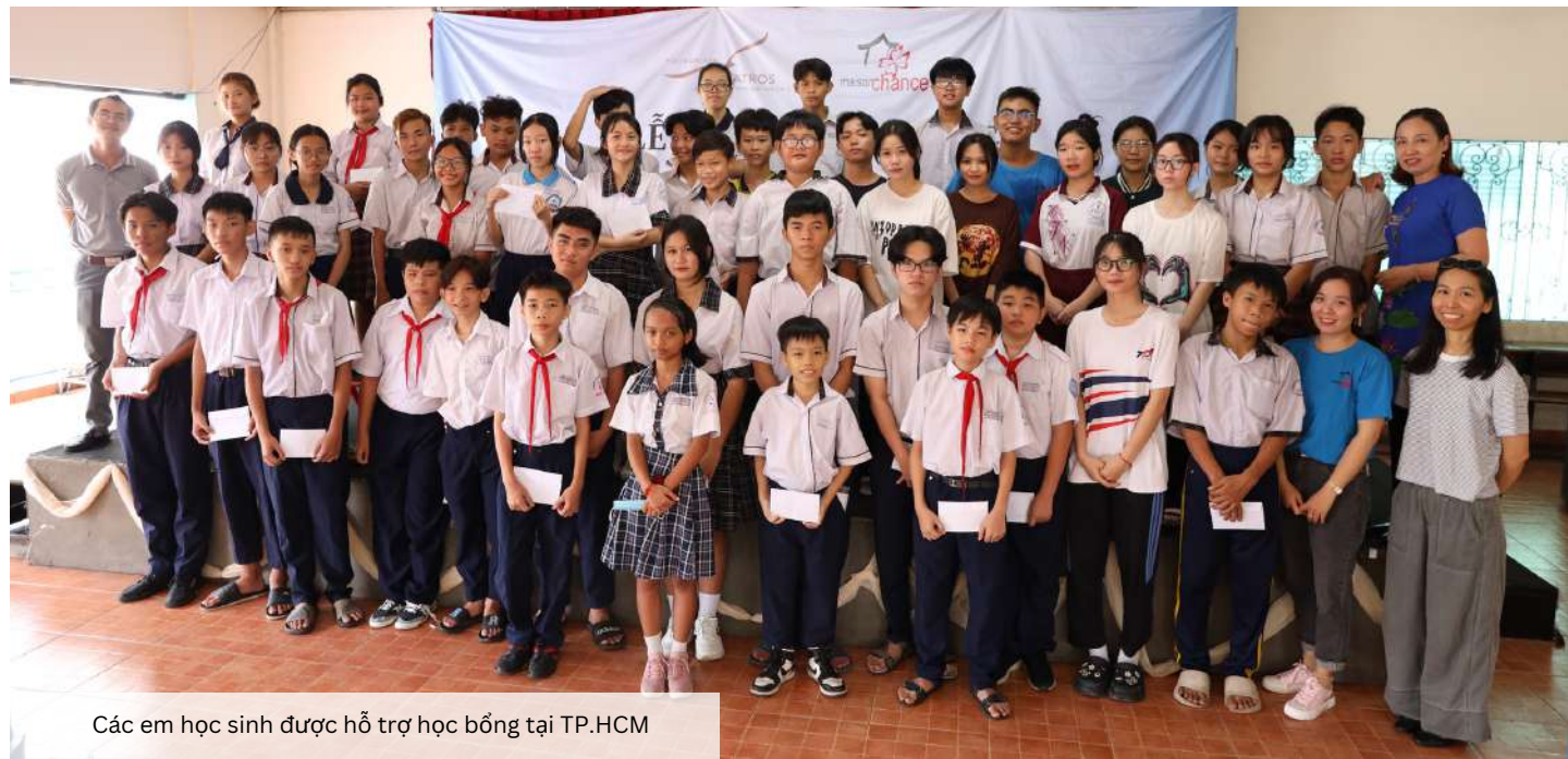
Các em học sinh được hỗ trợ học bổng tại TP.HCM

Năm học mới 2023 - 2024 bắt đầu vào tháng 8/2023 với 304 học sinh tiểu học và 135 em học sinh ở các cấp 2, 3 và ĐH.